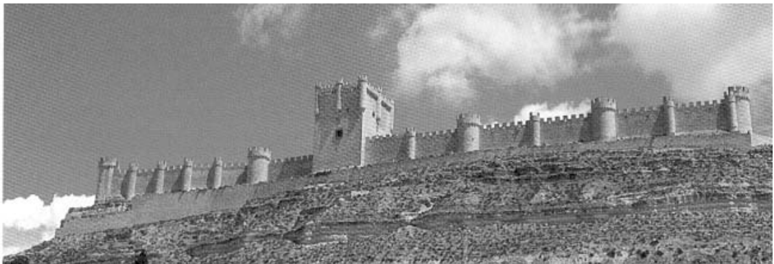
Castillo de Peñafiel

Club de Amigos de la Bici. Salamanca 2002